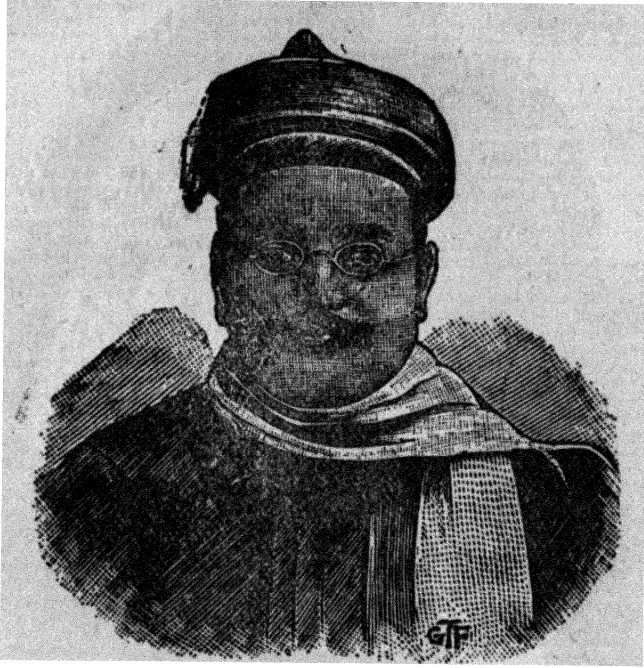
गोपाल कृष्ण गोखले